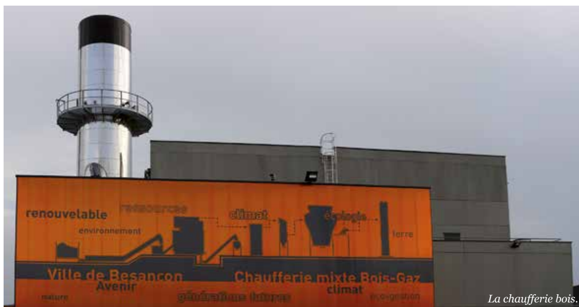
La chaufferie bois.

Le taux d'électricité renouvelable, autour de 10 % en Franche Comté, est ainsi passé dans un premier temps à 23 % puis en 2016 à plus de 50 % pour l'alimentation des bâtiments municipaux.