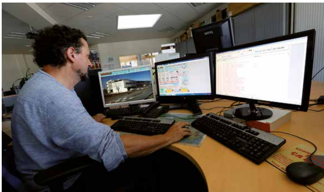
Gestion Technique Centralisée (GTC).

Ce système permet également de repérer les anomalies de fonctionnement des équipements, et ainsi l'intervention au plus rapide des agents de la régie d'exploitation des chaufferies.