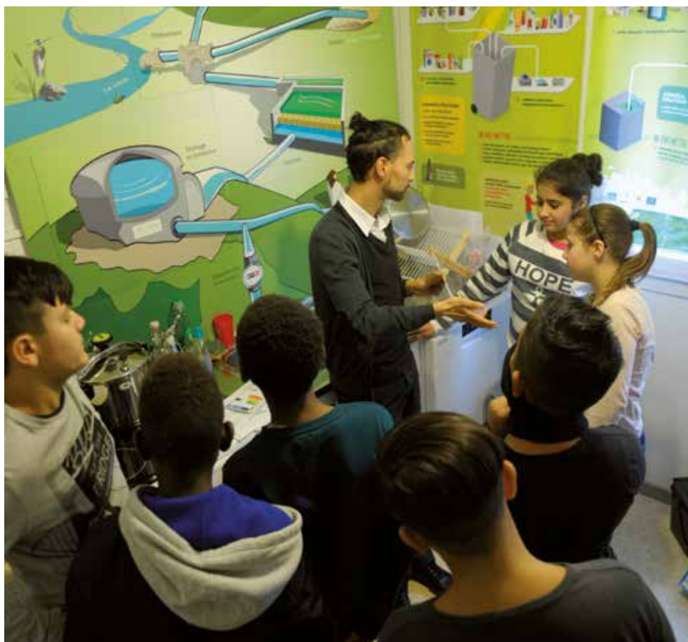
Animation au Logis 13 Éco.

Le Défi Familles à Energie Positive est également une initiative partagée du Grand Besançon et de la Ville qui donnent un cadre ludique et convivial à toutes les familles désireuses de se lancer dans la MDE à la maison. La première édition a mobilisé une cinquantaine de familles autour d'un objectif simple : baisser sa consommation de 8 % minimum. La deuxième édition du défi, prévue pour l'hiver 2017-2018 est déjà en cours de préparation.