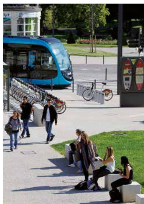
Tramway de Besançon et borne de vélos en libre-service à la Gare Viotte.

Autour de l'arrivée du TGV et de la mise en place du tramway, la Ville de Besançon a métamorphosé la gare centrale de Viotte en pôle d'échanges multimodal. L'enjeu majeur est le développement de la mobilité en créant une gare traversante, accessible à tous les modes de déplacements : car, bus, taxi, auto partage... une zone de stationnement sécurisée a été créée pour les motos et les vélos, où les utilisateurs de deux roues peuvent déposer leur casque ou utiliser des kits de dépannage (gonfleur de pneus, booster de batterie.). On trouve également des bornes de recharge pour les véhicules électriques. Ce pôle est accompagné d'un enjeu urbain avec le projet d'un aménagement d'un nouveau quartier doté de multiples fonctions (tertiaire, résidentiels, commerces).