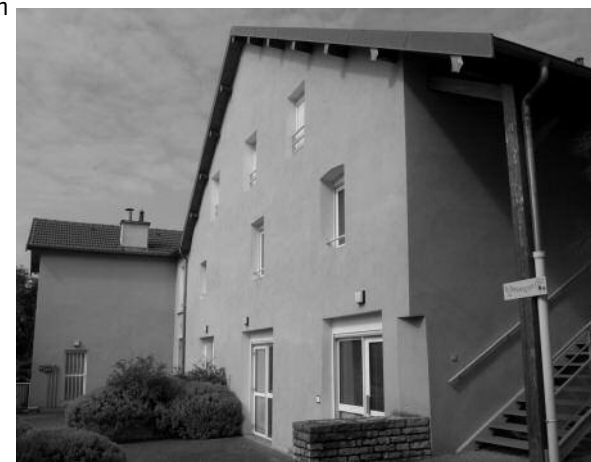
Maison de quartier de Saint-Claude