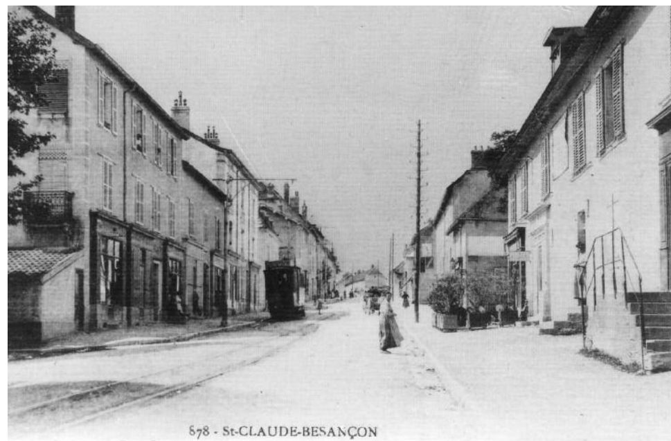
Rue de Vesoul au début du XX e siècle

Saint-Claude est donc un quartier vivant et offrant globalement un cadre de vie agréable. C'est ce qui explique son attrait et l'attachement des habitants à leur quartier. De plus, sa remarquable situation géographique pourra lui permettre de participer au développement futur de l'agglomération bisontine.