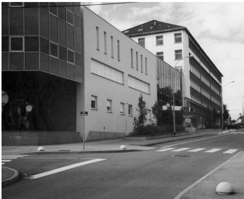
Entrée du lycée professionnel Montjoux