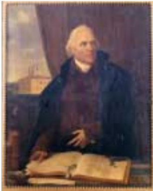
Portrait de Pierre-Adrien Pâris. Tableau de Jean-François Ducq, 1811.