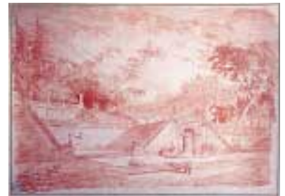
Hubert Robert. Terrasses des jardins de Portici, près de Naples. Contre-épreuve de sanguine, 1760.