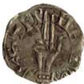
Monnaie frappée à Besançon au Moyen Âge : monnaie estevenante (avec la main de Saint Étienne).

Le fonds des monnaies et médailles est composé d'une belle collection grecque, gauloise, romaine et des divers monnayages européens. La Franche-Comté y est largement représentée.