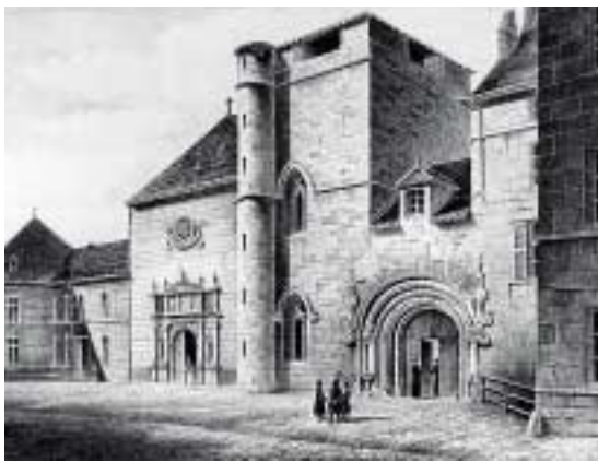
Ancienne abbaye de Saint-Vincent. Estampe.

Au début du XIX e siècle, manuscrits et ouvrages imprimés trouvent place dans le premier bâtiment en France construit pour accueillir une bibliothèque publique.