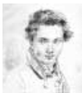
Portrait de Marnotte par Alexandre-Evariste Fragonard, dessin.

Historien, Charles Weiss (1779-1866) publie les papiers d'État des Granvelle : lettres de Charles Quint, de Philippe II, rapports des ambassadeurs, transmis aux cours d'Europe. Protecteur des artistes et des écrivains comtois, il est ami d'enfance de Charles Nodier et a été bibliothécaire de la ville de 1811 jusqu'à sa mort. Sous son impulsion, la bibliothèque se développe considérablement, passant de 50 000 à 130 000 volumes.