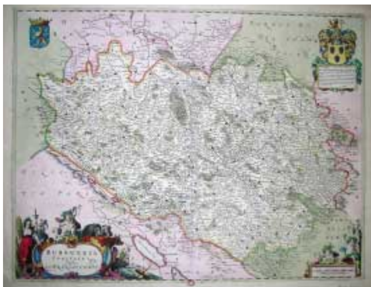
Carte de la franche-Comté. Amsterdam, 1663. Gravure sur bois enluminée.