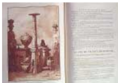
Jean-Pierre Louis Laurent Houel. Voyage pittoresque des îles de Sicile, de Malte et de Lipari. Paris, 1782, illustré de gravures au bistre.