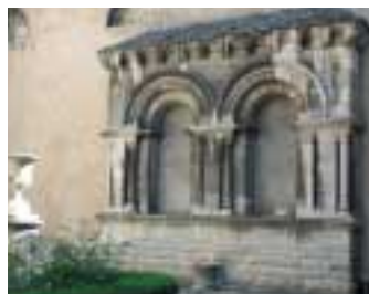
Cour de la bibliothèque : une parfaite harmonie règne sur trois des façades des quatre corps de bâtiments entourant la cour. Sur la quatrième, Charles Weiss fit remonter en 1835 une double arcade romane du XI e siècle, provenant d'une partie du clocher, démolie en 1832, de l'église abbatiale Saint-Paul de Besançon.

L'organisation des bibliothèques se confond ensuite avec celle des Écoles Centrales, créées en 1795. Des livres sont choisis dans le dépôt littéraire pour l'École Centrale, dont la bibliothèque ouvre ses portes en 1797. En 1802, les lycées remplacent les Écoles Centrales, il faut donc trouver d'autres lieux de dépôt pour les livres. Ce sont les greniers de la ville, place Neuve (actuelle place de la Révolution) pour les livres et tableaux et l'hôtel de ville pour les documents les plus précieux : manuscrits, sculptures, livres rares... Le 7 pluviôse an XI (28 janvier 1803), les livres provenant des dépôts littéraires sont remis aux soins des villes. Pour accueillir la bibliothèque, on décide d'utiliser l'emplacement du collège des Granvelle, fondé par le cardinal en 1549 et confié aux religieux de l'Oratoire qui desservaient l'église Saint-Maurice proche.