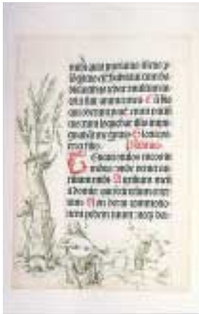
Livre de prières de Maximilien. Augsburg, 1514.