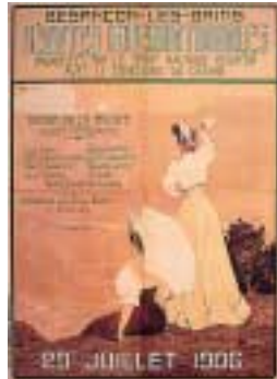
Affiche : Besançon-Les-Bains. Régates internationales organisées par le Sport Nautique Bisontin... 29 juillet 1906.

Le fonds régional, régulièrement enrichi, constitué de manuscrits (ainsi ceux réunis par Charles Duvernoy, historien du XIX e siècle, sur l'histoire de Montbéliard), de livres contemporains et anciens, de périodiques, de dessins, de monnaies, de cartes et de plans, se veut exhaustif sur la Franche-Comté. La base bibliographique comtoise, accessible à partir du catalogue informatisé des bibliothèques regroupe plus de 48 000 références : ouvrages et articles portant sur la Franche-Comté présents dans les bibliothèques municipales ou universitaires.