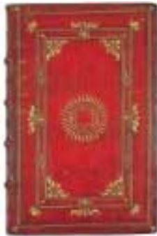
Reliure vénitienne en maroquin rouge doré exécutée pour le cardinal de Granvelle, XVI e siècle.

Dans les collections d'ouvrages de bibliophilie du XX e siècle, sont à signaler les publications des Bibliophiles Comtois.