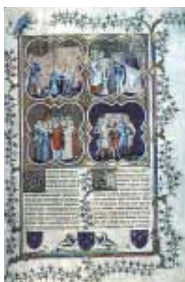
Traité philosophiques et moraux, manuscrit enluminé en 1372 pour le roi Charles V.