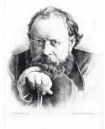
Portrait de Proudhon. Lithographie.