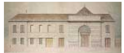
Élévation de la façade de la Bibliothèque de Besançon en 1884. Dessin.

À partir de 1808, sur des plans de l'architecte Denis Lapret, élève de Pierre-Adrien Pâris, puis sur des plans de Marnotte, est construit le premier bâtiment en France spécialement conçu pour être une bibliothèque publique. L'édifice est achevé en 1817; on y installe meubles et livres et la bibliothèque ouvre au public le lundi 27 avril 1818. La construction, qui sera augmentée à plusieurs reprises, jusqu'en 1839, présente quatre corps de bâtiments autour d'une cour centrale. De 1947 à 1987, les deux anciennes grandes salles de lecture sont aménagées en magasins de livres.