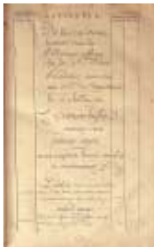
Catalogue des livres qui se sont trouvés dans la bibliothèque publique... : catalogue manuscrit de la bibliothèque publique avant la Révolution, tenu de 1762 à 1791.

“Quand je pense à tous les livres qu'il me reste encore à lire, j'ai la certitude d'être encore heureux”