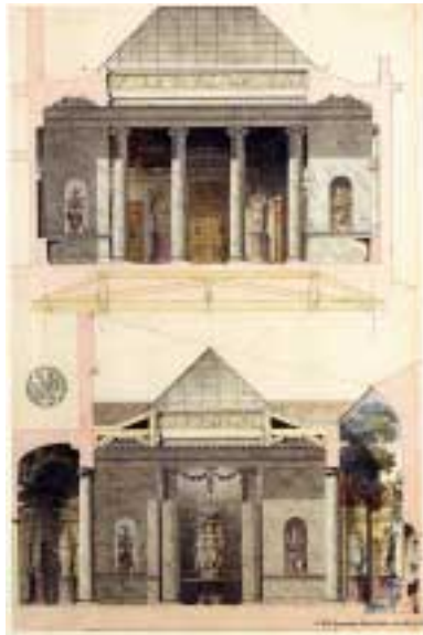
Pierre-Adrien Pâris. Hôtel de l'intendant des postes d'Arboulin de Richebourg, à Paris. Aquarelle. [coll. Pâris, vol.484, n°56]

Les dons, legs et achats qui sont faits à la bibliothèque l'enrichissent de pièces majeures. Parmi ceux-ci, celui de Pierre-Adrien Pâris (1745-1818) est l'un des plus importants. Architecte et dessinateur de Louis XVI, il lègue à sa ville natale l'ensemble de son cabinet, d'un goût raffiné : tableaux, dessins, antiquités et livres, d'une très grande richesse.