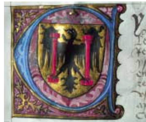
Armes de Besançon. Enluminure dans un registre de comptes de la Ville, XVI e siècle.

Ce service conserve les archives de la Ville de Besançon depuis 1290, constituées des documents produits par les services de la commune. Très divers (registres paroissiaux puis d'état civil, budgets et comptes, dossiers techniques de bâtiments, etc...) ils permettent de retracer l'histoire de la ville.