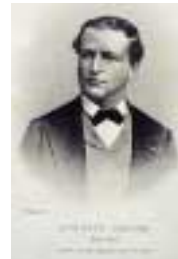
Auguste Castan. Estampe.

Après des études à l'école des Chartes, Auguste Castan (1844-1892) devient l'adjoint de Charles Weiss en 1855, puis bibliothécaire en 1866. Historien, archéologue, il entreprend l'étude des édifices romains de la ville et fouille en 1870 le site baptisé en 1898 square Castan, qu'il pense être le théâtre antique de Besançon. Il publie des travaux scientifiques sur les fonds de la bibliothèque (le catalogue des manuscrits et celui des incunables notamment) et se consacre à son organisation et à son fonctionnement, ainsi qu'à l'accroissement des collections.