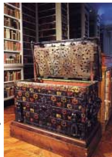
Coffre de la ville de Besançon. Fin xv e siècle.

La création du musée, en 1843, amena à retirer certains objets du musée mais sont restés quelques tableaux, essentiellement des portraits de célébrités locales, des sculptures de James Pradier, Luc Breton, Pierre-Jean David d'Angers et des meubles dont le coffre en fer renfermant le trésor de la ville -c'est à dire ses titres de propriété- depuis le xv e siècle ; ainsi que le bureau de Pierre-Adrien Pâris, qu'il avait lui-même dessiné.