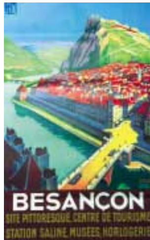
Affiche PLM, début xx e siècle.