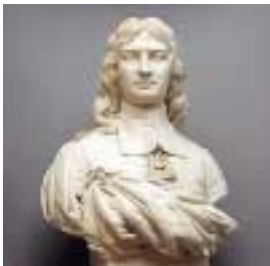
Boisot. Buste en marbre par Jean Petit.