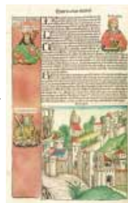
Hartman Schedel, Chronique universelle , Incunable imprimé à Nuremberg, 1499. Gravure sur bois coloriée.