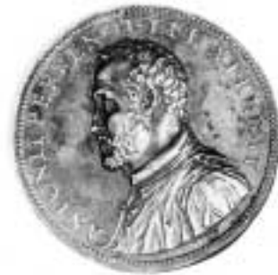
Antoine de Granvelle. Médaille d'argent à son effigie, xvi e siècle.

Les ouvrages et œuvres d'art réunis par Jean-Baptiste Boisot, abbé de Saint-Vincent sont issus de plusieurs origines, mais une grande partie provient des prestigieuses collections ayant appartenu à Nicolas de Granvelle et à son fils Antoine, hommes politiques, mécènes, grands collectionneurs. Cette magnifique collection eût été totalement dispersée par les héritiers de Granvelle si Boisot n'avait cherché à la réunir et n'avait acquis en 1664 une grande part de cet ensemble.