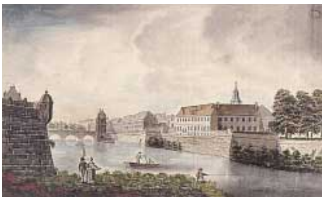
Vue des quais du Doubs et du pont Battant. Aquarelle, XVIII e siècle.

Pôle associé de la Bibliothèque Nationale de France, la bibliothèque municipale reçoit depuis 1956 le dépôt légal des imprimeurs des quatre départements de Franche-Comté. Elle assure la collecte et la conservation de ce fonds très varié (monographies, brochures, périodiques, tracts, affiches, cartes postales, plans...) ainsi que sa diffusion par l'intermédiaire de son catalogue.