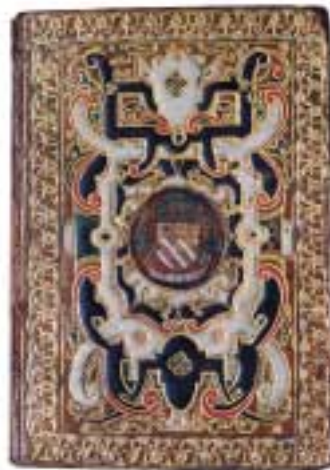
Reliure cires polychromes aux armes du cardinal de Granvelle, XVI e siècle.