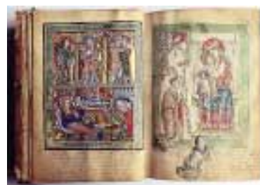
Psautier dit de Bonmont , manuscrit, vers 1260.

Le livre le plus ancien est le Liber de natura rerum d'Isidore de Séville (fin VIII e siècle). Les manuscrits médiévaux remarquables sont très nombreux : le Psautier de Bonmont exécuté dans une abbaye cistercienne au XIII e siècle, les Traité philosophiques et moraux enluminés pour le roi Charles V en 1372, les Chroniques de Froissart dans une version importante pour l'élaboration du texte, au XV e siècle, les Œuvres de saint Denis l'Aéropagite réalisées à Florence pour le roi de Hongrie Mathias Corvin, de nombreux livres d'heures du XV e siècle, ainsi que des livres liturgiques du X e au XV e siècle. Les papiers d'État du cardinal de Granvelle occupent quatre-vingt volumes. Les collections conservent d'autres types de manuscrits : documents littéraires, historiques ou scientifiques, correspondances, autographes (jusqu'au XX e siècle), et un fonds de partitions musicales manuscrites où l'on trouve des œuvres de Lully.