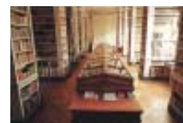
La salle d'exposition a gardé son volume d'origine, ainsi que ses boiseries qui sont celles dessinées par Marnotte.

À partir de 1808, sur des plans de l'architecte Denis Lapret, élève de Pierre-Adrien Pâris, puis sur des plans de Marnotte, est construit le premier bâtiment en France spécialement conçu pour être une bibliothèque publique. L'édifice est achevé en 1817; on y installe meubles et livres et la bibliothèque ouvre au public le lundi 27 avril 1818. La construction, qui sera augmentée à plusieurs reprises, jusqu'en 1839, présente quatre corps de bâtiments autour d'une cour centrale. De 1947 à 1987, les deux anciennes grandes salles de lecture sont aménagées en magasins de livres.