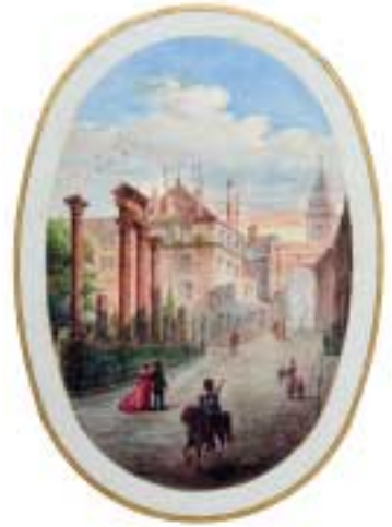
Square Castan. Page de titre du Théâtre romain de Vesontio . Aquarelle de Ducat, 1872.