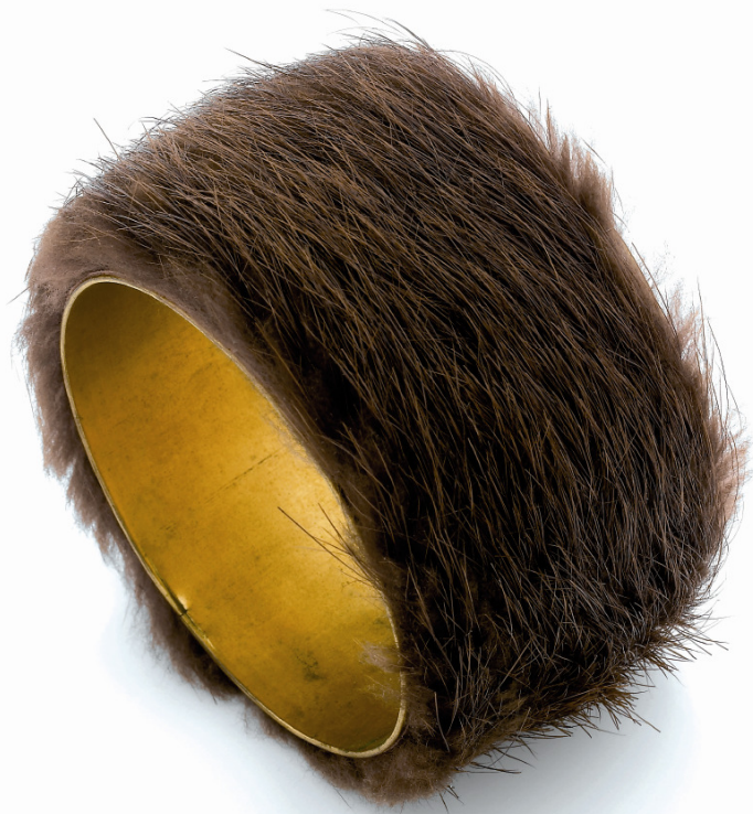
MERET OPPENHEIM BRACELET, 1935. FOURRURE ET MÉTAL, Ø : 7 cm.

11 JUIN ... 11 OCTOBRE 2009 PALAIS GRANVELLE ... MUSÉE DU TEMPS 96 ... GRANDE RUE ... BESANÇON 25000 BESANÇON TÉL ... 03 81 87 81 50 ... BESANÇON