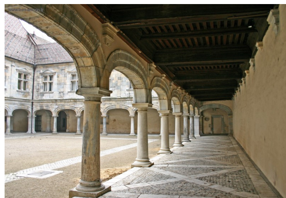
Cour du palais Granvelle

Après les années Granvelle, le palais est loué puis acheté par la Ville. Au moment de la conquête de la Franche-Comté par la France, donc au moment du passage de Vauban, on y loge les gouverneurs de la nouvelle province. En 1683, Louis XIV, venu prendre officiellement possession de la ville, est logé au palais ; ce dernier, pour trois jours, prend le nom de Louvre et le Roi y reçoit les corps constitués.