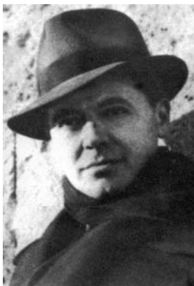
Jean Moulin dans la clandestinité