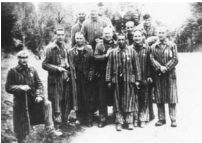
Photo d'un groupe de déportés prise dans la région de Donauschingen, après la libération d'Allach (commando de Dachau)

La résistance est sans cesse menacée et remise en cause par les arrestations : ainsi en février 1944 dans la région de Besançon.