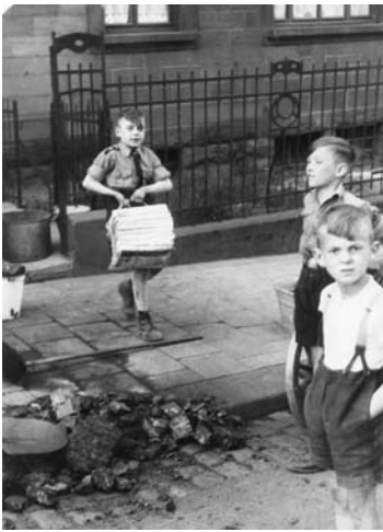
Jeune hitlérien participant à la récupération de vieux papiers — Sarrbrück

Comment les jeunes sont-ils éduqués ? Que leur apprend-on ?