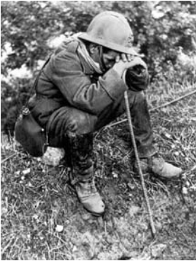
Soldat français accablé par la défaite de 40

La France est abasourdie par sa défaite de mai-juin 1940. Elle est alors livrée aux exigences du vainqueur : ses soldats sont retenus prisonniers en Allemagne ; elle est morcelée, occupée en partie puis — à partir de novembre 1942 — en totalité. Soumise à l'ordre nazi, elle subit les contrôles policiers, les arrestations, les déportations. Livrée au pillage économique, elle connaît les privations et restrictions, le marché noir s'installe.