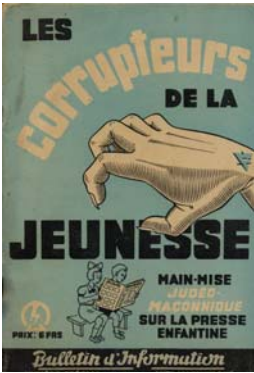
Brochure de propagande

Que proposent les mouvements collaborationnistes — tels que le PPF, le RNP, le francisme — à la jeunesse de France ?