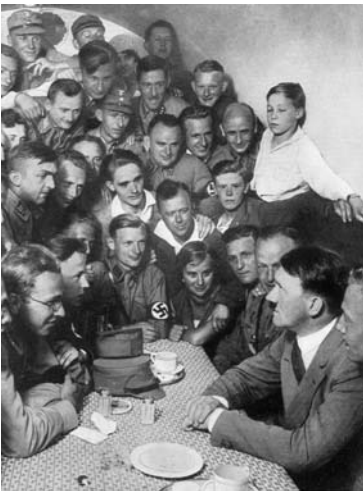
Jeunes fascinés par Hitler à la Braune Haus (quartier général des troupes de choc) Munich

Citez un exemple d'organisation de jeunesse que vous connaissez ailleurs qu'en Allemagne avant la guerre.