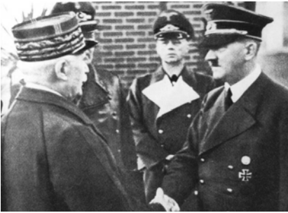
Poignée de mains de Montoire, 24 octobre 1940 Droits réservés

Dès le mois d'Octobre 1940, le maréchal Pétain décide d'entrer dans la voie de la collaboration (entrevue de Montoire avec Hitler). Cette collaboration s'accroît encore avec le retour au pouvoir de Laval comme chef du gouvernement en avril 1942. Elle facilite l'exploitation économique de la France, elle se traduit par l'envoi de travailleurs français en Allemagne ("relève" en juin 42, puis "Service du Travail Obligatoire" en février 43), par la création de la milice aux ordres de Darnand et des nazis, par l'envoi de combattants volontaires français sous uniforme allemand sur le front russe (Waffen SS, LVF). Mais la honte de Vichy, c'est surtout d'avoir aidé l'occupant à déporter les résistants, les étrangers et les juifs.