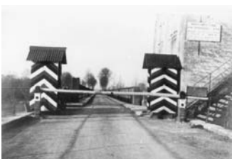
Montbarrey-sur-Loue (Jura) : poste de contrôle allemand de la ligne de démarcation

Face à la “défaite la plus écrasante de l'histoire de France”, les Français sont alors placés devant un “choix historique” : le maréchal Pétain après l'armistice du 17 juin 40 supprime la République et établit un nouveau régime autoritaire et policier, l'État français ou régime de Vichy, qui décide de collaborer avec l'occupant. Le 18 juin 40 la radio de Londres diffuse un appel à la résistance française lancé par le général De Gaulle.