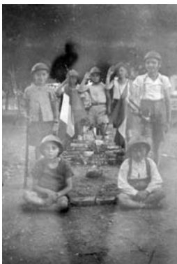
Manifestation patriotique d'enfants à Clerval (Doubs) le 14 juillet 1940

LE REFUS : LES DÉBUTS DE LA RÉSISTANCE, UNE RÉSISTANCE INDIVIDUELLE ET SPONTANÉE.