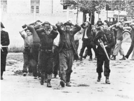
Arrestation de résistants par des miliciens — Savoie, 1944

Que proposent les mouvements collaborationnistes — tels que le PPF, le RNP, le francisme — à la jeunesse de France ?