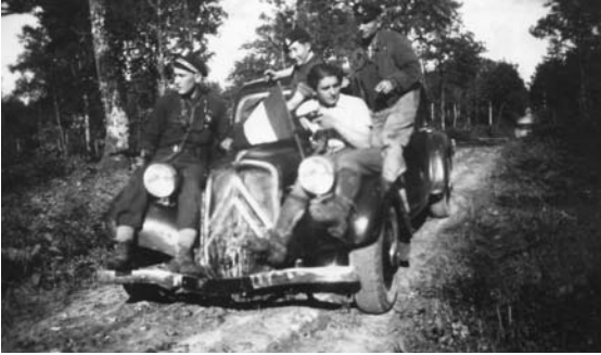
Maquisards FTP de Fontainebrux à la libération (Jura)

La résistance a activement participé à la libération du pays, et pour cela les maquis ont joué un rôle prépondérant. Mais la résistance a aussi préparé l'après-guerre par la mise en place des Comités Départementaux de Libération.