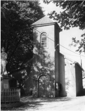
Église de Larnod (Doubs) : le clocher sert de cache d'armes