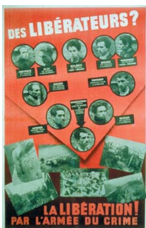
L'Affiche rouge

Qui sont Tamas Elek né en 1924 et Marcel Rayman né en 1925 ? Qu'ont-ils fait ? Que sont-ils devenus ?