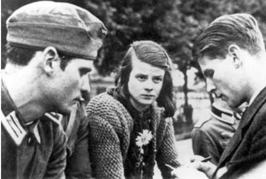
Hans Scholl, Sophie Scholl et Christophe Probst

Dans toute l'Europe occupée apparaissent des mouvements de résistance et même en Allemagne. Cette résistance européenne ressemble à celle que vous avez rencontré en France. Des jeunes y participent, pour les mêmes raisons, avec les mêmes moyens et souvent le même sort tragique.