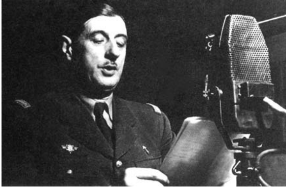
De Gaulle au micro de la BBC le 3 octobre 1941

Après son appel du 18 juin 1940, le général de Gaulle crée à Londres la France Libre, gouvernement en exil auquel tous les Français qui veulent continuer la lutte sont appelés à se rallier.