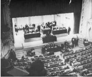
Vichy, 10 juillet 1940 : vote des "pleins pouvoirs" à Pétain

Le régime de Vichy est-il un régime démocratique ? Pourquoi ?