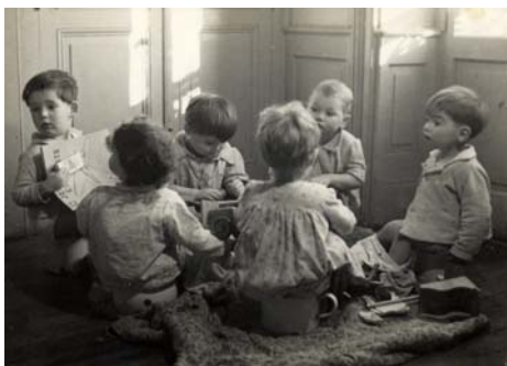
Hiver 1941-1942 : enfants recueillis par le réseau d'entraide juif de l'OSE dans un home d'enfants près de Limoges

En Franche-Comté comme ailleurs, il existe au printemps 1944, un véritable État clandestin de la Résistance reconnaissant l'autorité du CNR et du gouvernement provisoire d'Alger et prêt à se substituer à l'administration obéissant aux ordres de Vichy et des Allemands.