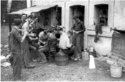
Corvée traditionnelle au maquis "Les Grimes" : les patates

Au 6 juin 1944. La Résistance est alors partout présente et structurée même si sur le terrain les choses ne sont pas si simples : héritage de l'ancienne ligne de démarcation, les FFI de Franche-Comté relèvent de deux commandements distincts : région D (Dijon) au nord, et région R1 (Lyon) dans le Jura.