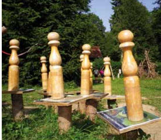
LA FÊTE « FORÊT'N »