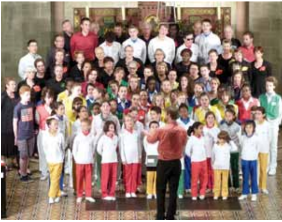
LES ENFANTS DE L'ESPOIR