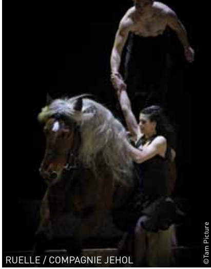
RUELLE / COMPAGNIE JEHOL