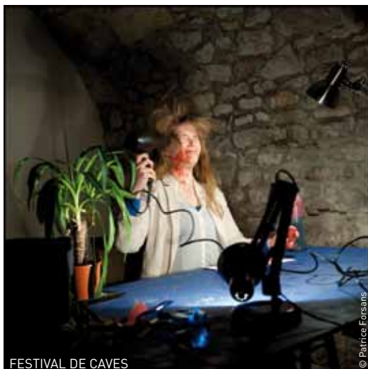
FESTIVAL DE CAVES