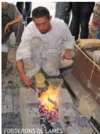
FORGERONS DE LAMES