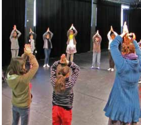
L'ART À L'ÉCOLE