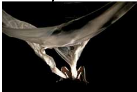
SOUS VIDE / PROJET D