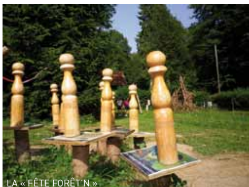
LA « FÊTE FORÊT'N »