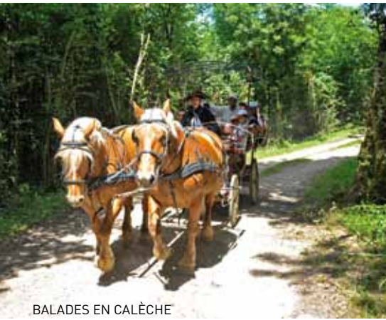
BALADES EN CALÈCHE