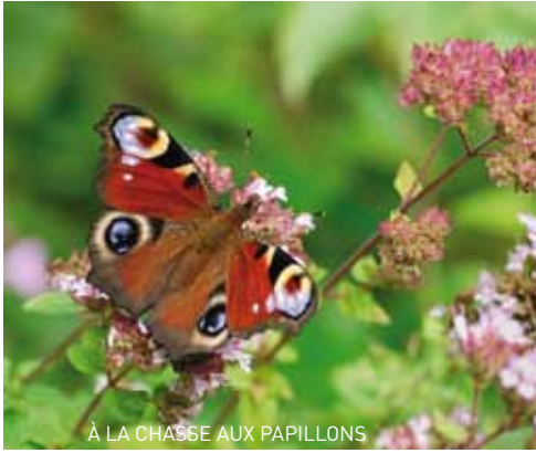
À LA CHASSE AUX PAPILLONS