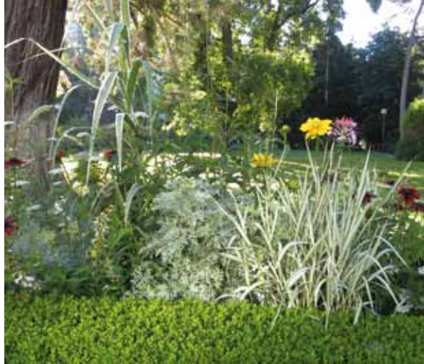
FLEURISSEMENT ESTIVAL PROMENADE MICAUD