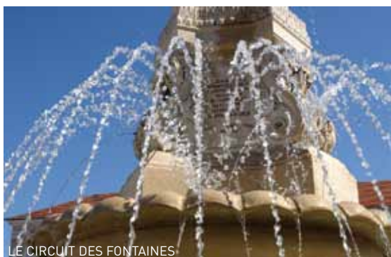
LE CIRCUIT DES FONTAINES