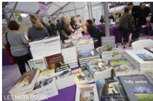
LES MOTS DOUBS