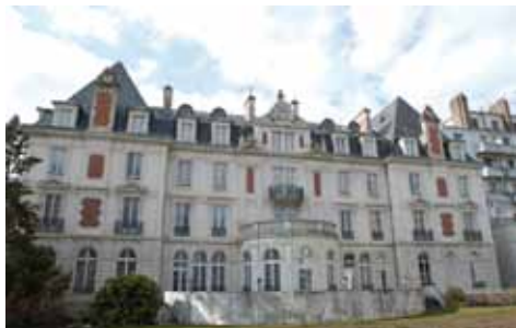
HÔTEL DES BAINS