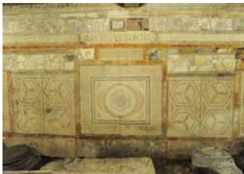
DOMUS DE LA FACULTÉ DE LETTRES

maison à l'époque Antonine. Certaines mosaïques attestent d'une première occupation plus ancienne.