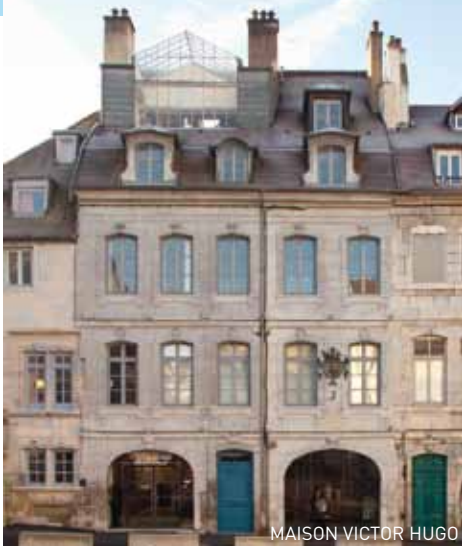
MAISON VICTOR HUGO