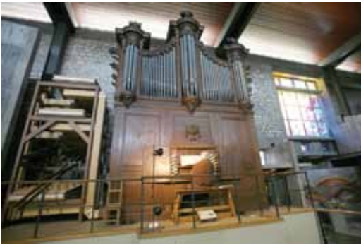
ÉGLISE SAINT-LOUIS DE MONTRAPON