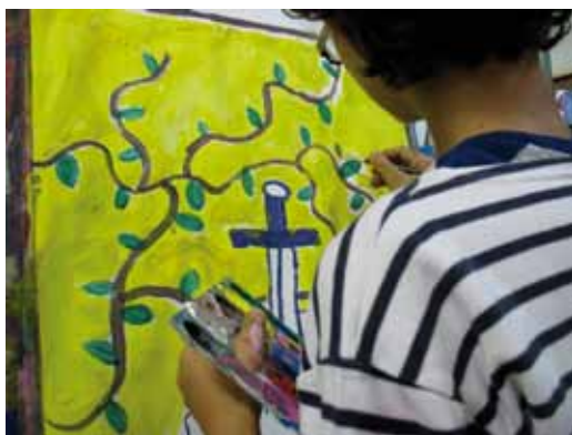
DESSIN, MODELAGE, MANGA

Une balade en forêt de Chailluz pour découvrir les vestiges et les traces des