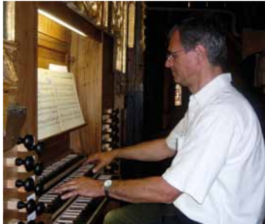
LES AMIS DE L'ORGUE

Découverte de la gestion écologique d'un square ayant reçu le label national