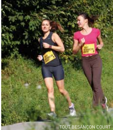
TOUT BESANÇON COURT