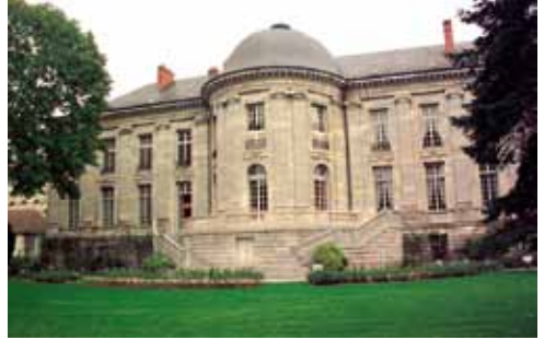
HÔTEL DE GRAMMONT

Trésorier de la chambre épiscopale, le chambrier est l'un des officiers qui