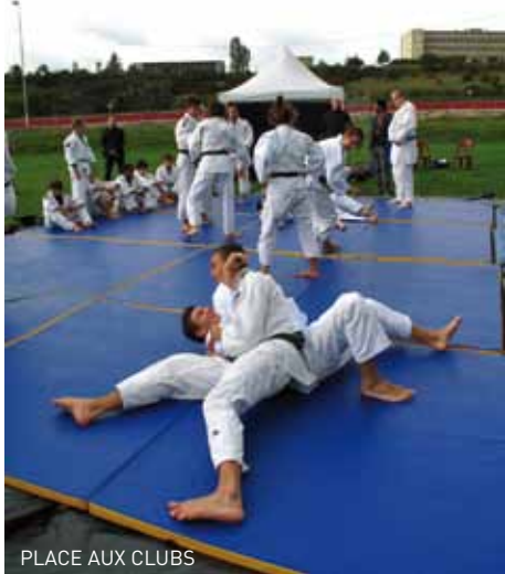
PLACE AUX CLUBS