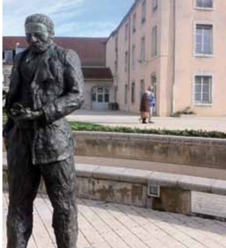
LA SCULPTURE DANS LA VILLE