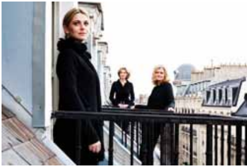
TRIO GEORGE SAND