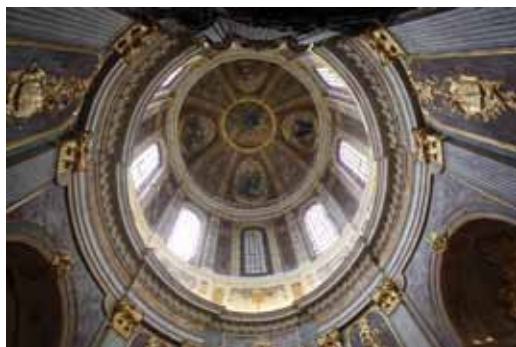
CHAPELLE NOTRE-DAME DU REFUGE

Sur le mont des Buis existait de longue date un lieu de culte érigé au point de convergence des voies antiques venant de Suisse et d'Italie. À proximité, le monument de la Libération a été édifié après 1945,