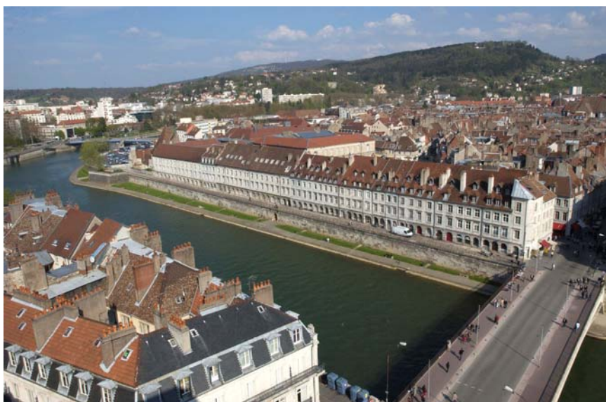
Pont Battant actuel – Un trait d'union avec la Boucle

Ce pont est le trait d'union entre la Boucle et le premier faubourg historique de la capitale des Séquanes