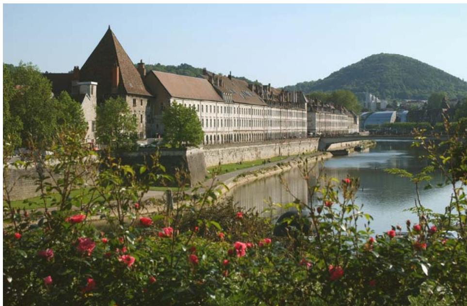
L'actuel pont Battant – Vue depuis les quais Vauban

L'ensemble de ces travaux liés au Pont Battant est réalisé par Bouygues TP Régions France .