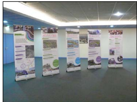
Exposition Réunion publique à Micropolis