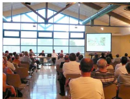
Réunion publique à Ecole-Valentin