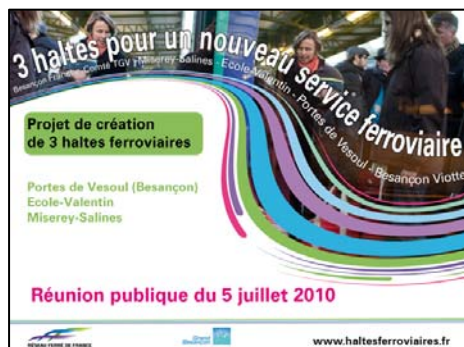
Couverture du diaporama

Lors des réunions publiques, les thèmes abordés ont été les mêmes que lors des réunions ciblées : enjeux du projet, variantes, différents scénarios proposés, modalités de concertation, etc. A l'issue de la présentation, un débat d'une durée de 1h30 à 2 heures, s'est engagé avec le public. Toutes les questions, avis, commentaires et réponses ont fait l'objet d'un enregistrement audio.