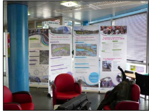
Exposition Hall du Grand Besançon