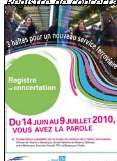
Registre de concertation