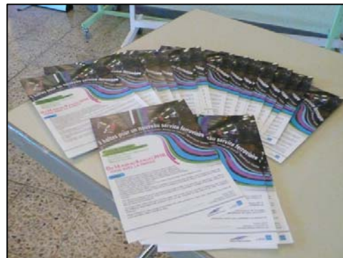
Couverture du dépliant 3 volets, A4 plié